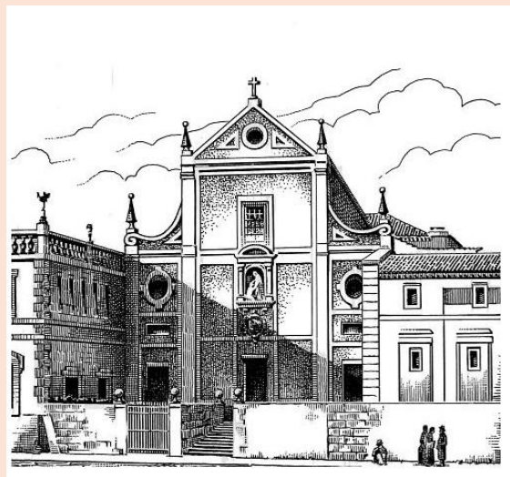
Iglesia de San Antonio del Prado en Madrid

Pero la gran obra de DON LUIS DE TRELLES fue la fundación de la Adoración Nocturna en España. El sábado, 23 de agosto de 1862 tuvo el honor de hacer una noche de oración al Santísimo Sacramento en París, y a su vuelta decidió instaurarla también en España. Pero este sueño precisó de largas y fatigosas gestiones, pues la situación política no permitía reunirse de noche en las iglesias, y tardó algún tiempo en ponerse en práctica. No lo consiguió hasta la noche del 02.11.1877 en