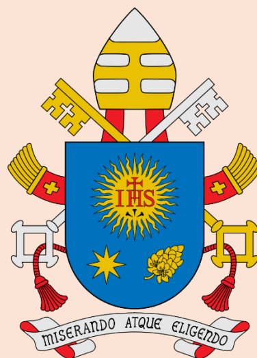
Escudo del Papa Francisco

24. No todo aumento de poder es un progreso para la humanidad. Basta pensar en las tecnologías “ admirables ” que fueron utilizadas para diezmar poblaciones, lanzar bombas atómicas, aniquilar etnias. Fueron momentos históricos donde la admiración ante el progreso no dejaba ver lo horroroso de sus efectos. Pero este riesgo está siempre presente, porque «el inmenso crecimiento tecnológico no estuvo acompañado de un desarrollo del ser humano en responsabilidad, valores, conciencia [···].