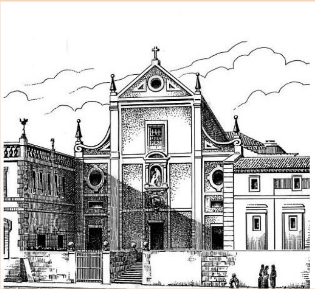
Iglesia de San Antonio del Prado, donde se celebró la primera vigilia de la Adoración Nocturna en España.

(Lámpara del Santuario - Tomo 7, 1876 - pag.172)