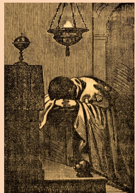
Fuge... Tace... Quiesce...