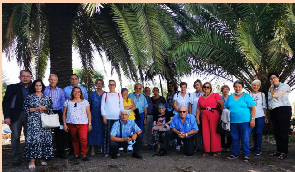
Parte de grupo que asistió al Pleno Diocesano de la ANE canaria

El sábado 2 de octubre nos reunimos en el Seminario Diocesano en Tafira. Asistieron representantes de casi todos los grupos de la isla, incluso de Lanzarote. Tras un