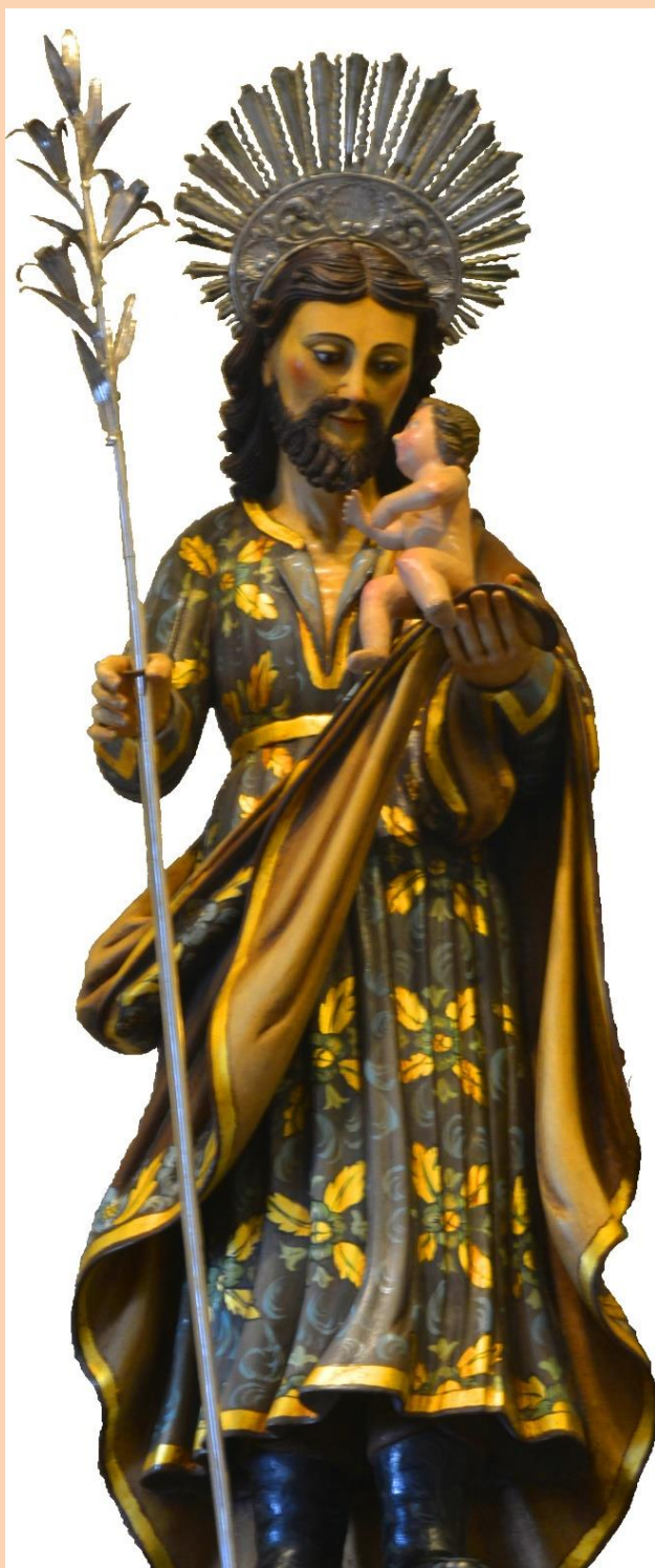
Imagen del Patriarca san José que se venera en la Iglesia Parroquial de Bayona (Pontevedra)

A primera vista no hay conexión ninguna entre estos dos asuntos, porque es de tradición incontestada, que el Padre nutricio y putativo de Jesús, falleció antes de la vida