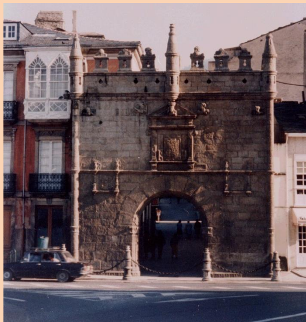
Puerta de Carlos V. Entrada a la Villa de Viveiro