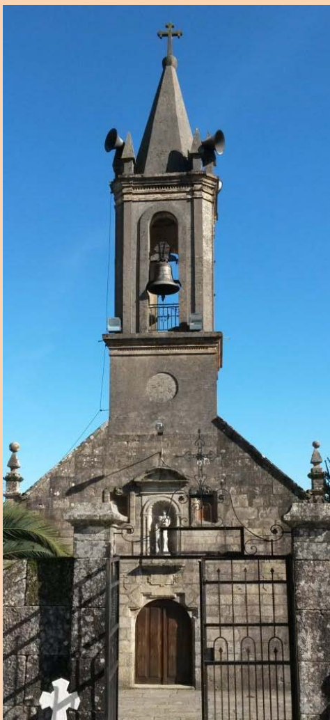
Iglesia de San Cristobal de Mourenán