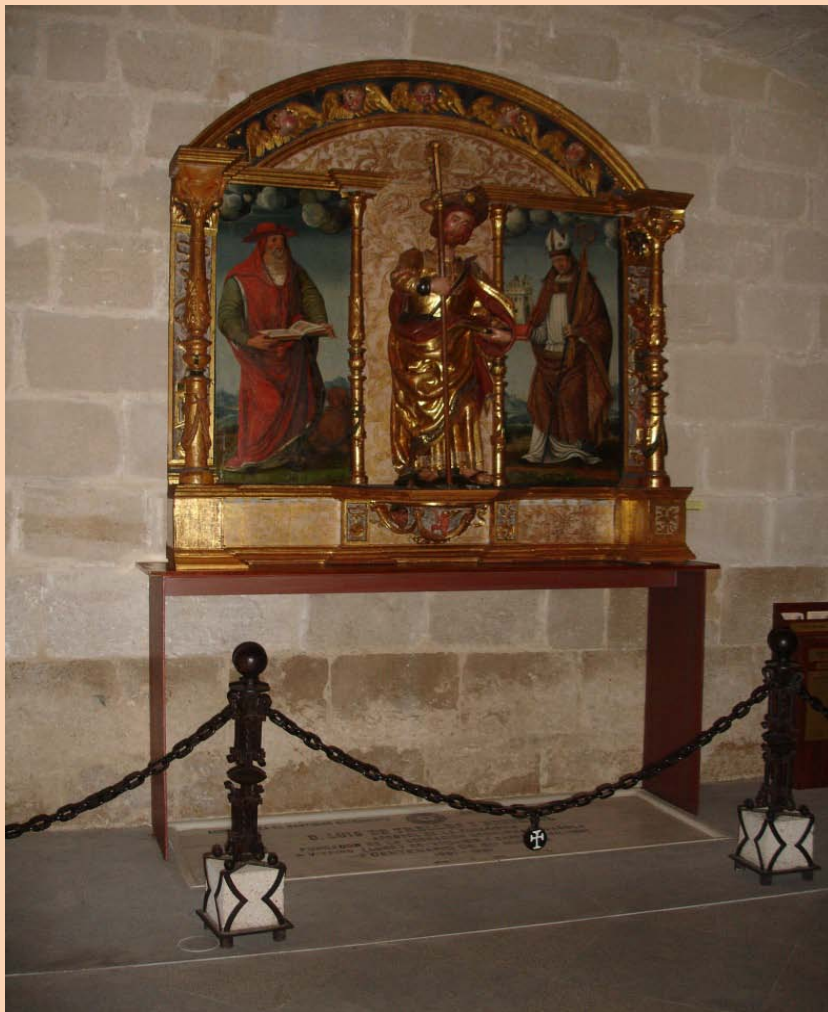
Antiguo frontal de la sepultura del Venerable L. de Trelles en la S. I. Catedral de Zamora

El nacimiento de María si bien se considera, es el crepúsculo matinal del día de la redención del mundo y no se interrumpe ésta feliz serie, hasta que años más tarde la rosa de Nazaret, como la tierra de profecía, produce sus fruto de verdad, que la justicia divina mira desde el cielo. Así en María y por María el Señor, continuando el salmo LXXXIV; nos dará la benignidad y siendo esta dulce Madre verdadera Madre nuestra, producirá su fruto, es decir, aquél para él que estaba preparada, marchando ante ella la justicia que guía sus pasos en la senda de la perfección.