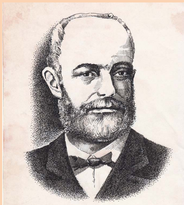
Luis de Trelles en los comicios electorales a Cortes españolas donde es elegido Diputado por Vilademuls – Gerona (1871)

Establecido el asunto sobre el cual queremos fijar la atención de nuestros queridos lectores, conduce a nuestro intento investigar por qué vino allí en aquellas condiciones, a qué vino, y qué requiere de nosotros en tal concepto. En pocas palabras nos prometemos escudriñar y meditar la Soledad del Señor en el Santísimo Sacramento con el misterio, la vocación y la correspondencia que obtiene aquella, para admirar y estimar lo primero, atender a la segunda y mejorar la tercera.