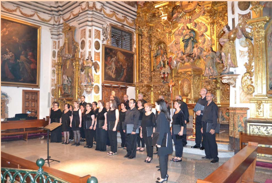
Actuación de la Coral "Vientos del Pueblo", de Borja

Por la tarde visitamos Borja, su ciudad y museos. Destacaríamos el concierto de la CORAL "VIENTOS DEL PUEBLO" . Fue extraordinario, con un magnífico registro y tesitura, que hizo las complacencias del auditorio.