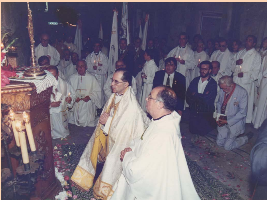
Procesión Eucarística por la calle "Luis de Trelles en Viveiro (Lugo) el 30/06/1990 ante la casa en donde nació el VENERABLE LUIS DE TRELLES. En primer término el Nuncio Mons. Tagliaferri y Mons. Gea Escolano, Obispo de Mondoñedo-Ferrol.

¿Tienes correo electrónico? Facilítaselo a la Fundación, ayudarás a sus gastos y recibirás información más cercana y actual. Gracias