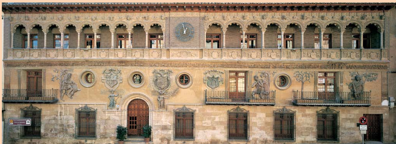
Fachada Excmo. Ayuntamiento de Tarazona

En esta colegiata se mezclan varios estilos. Posee dos esbeltos campanarios. La iglesia, de una sola nave, tiene ábside poligonal y capilla entre los contrafuertes. En el exterior predomina el mudéjar, mientras que su interior es barroco. Destacan el retablo mayor, el órgano y las tablas góticas de la sacristía. El claustro fue construido en el siglo, XV. En el siglo XIX se le añadió el pórtico.