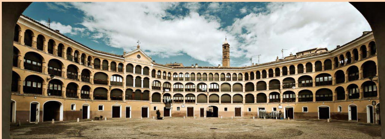
Plaza de Toros vieja de Tarazona